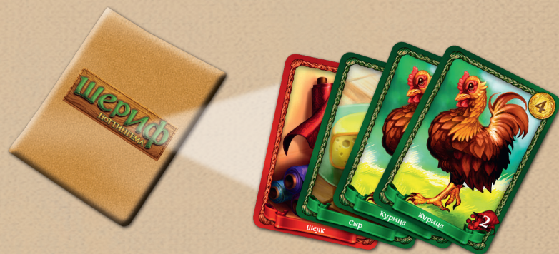
Товары в мешке